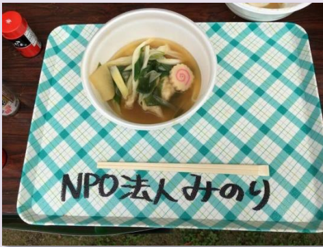
昨年度は“すいとん”を作りました

「上尾市ふれあい広場」に出店します。 今年は、10月にリニューアルオープン予定の「上尾市文化センター」に会場を移して開催します。だれにとっても暮らしやすい真の共生社会づくりを目指して、37年目となる歴史あるイベントです。今回みのりは「まっくらカフェ」を出店します。アイマスクを着用し、視覚以外の感覚を駆使してチャレンジする体験型のカフェです。是非お越しく下さい。 日時…10月15日(日) 10時～