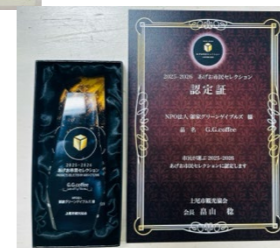
上尾市民セレクション