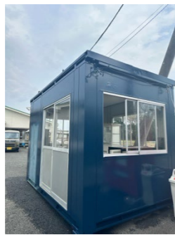
直売所リニューアル (さわやか福祉財団様)