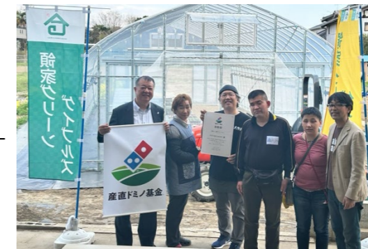
産直ドミノ基金アワード2024