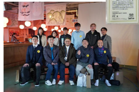
isee! Working Awards 2025