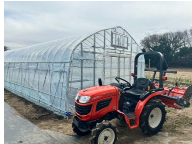
ビニールハウス・トラクター (森村豊明会様) (丸紅基金様)

これからもいただいた助成を大切に活かしながら、みんなが安心していきいきと過ごせる場所作りに力を入れていきたいと思ひます。