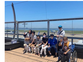
羽田空港テラスにて