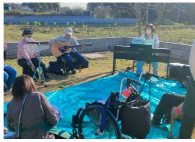
電子ピアノ・スピーカー (一般社団法人 芳心会様)