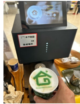
ラテアートプリンター (木下財団様)