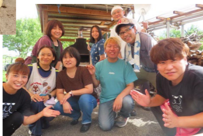
まいこさん特製のピザ！