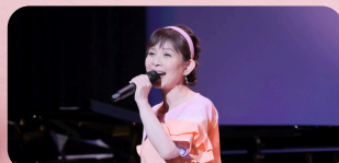
山野さとこ ファミリーソングシンガー 1986年NHK「ゆかいなコンサート」司会 と歌のお姉さんとしてレギュラー出演